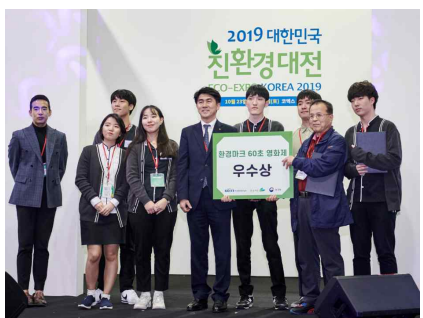
시상식 (환경마크 60초 영화제 시상식)