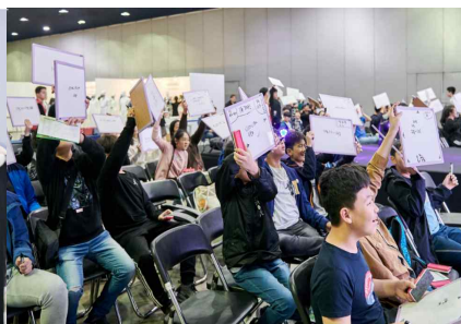
특별 프로그램 (도전! 에코 골든벨)