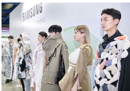
특별 프로그램 (지속가능한 패션 퍼포먼스)