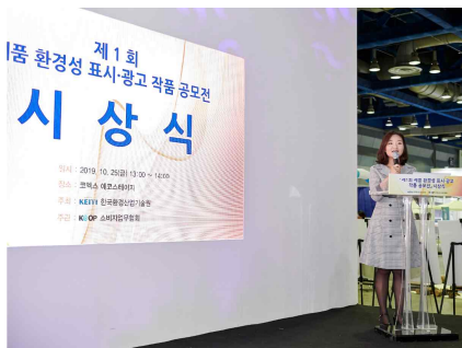
시상식 (제품 환경성 표시·광고 작품 공모전 시상식)