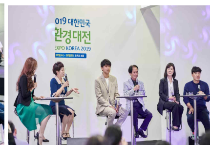
특별 프로그램 (에코세바시)